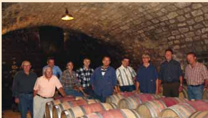
Vorstand und Kellermeister der Winzergenossenschaft Kallstadt